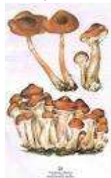
a vál cvak