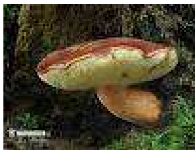
suchohřib – hřib hnědý